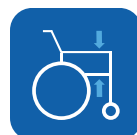
Hoogte armleuningen ▼