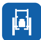
Totaal gewicht ▼