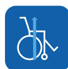
Totale hoogte ▼