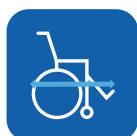
Totale lengte incl. voetsteunen ▼